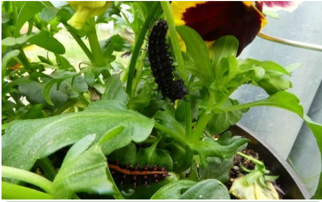
ツマグロヒョウモン幼虫(前蛹)