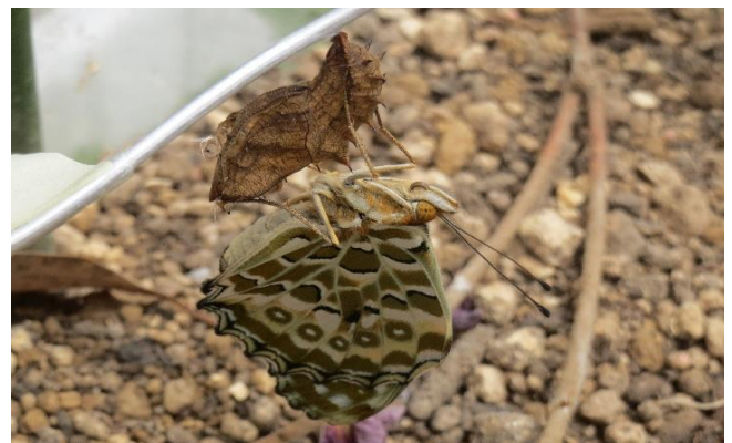
ツマグロヒョウモン羽化