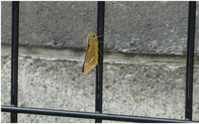
イチモンジセセリ