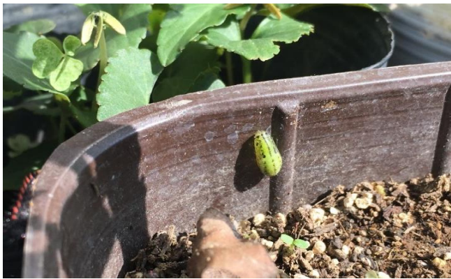
ヤマトシジミ蛹化