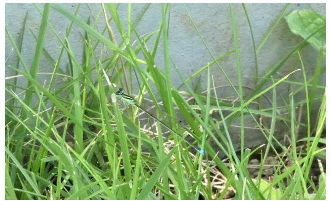
アジアイトトンボ