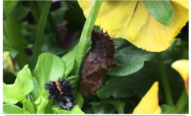
ツマグロヒョウモン蛹化