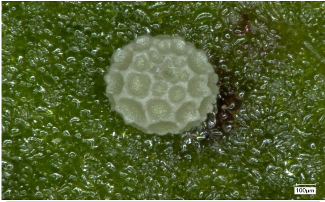
ベニシジミの卵(顕微鏡にて)