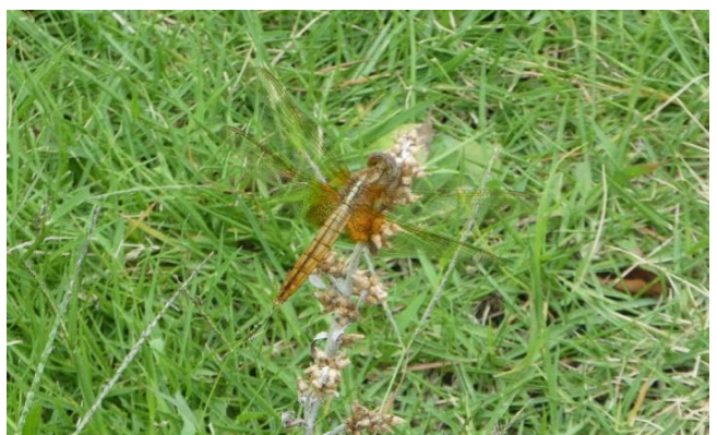
ショウジョウトンボ