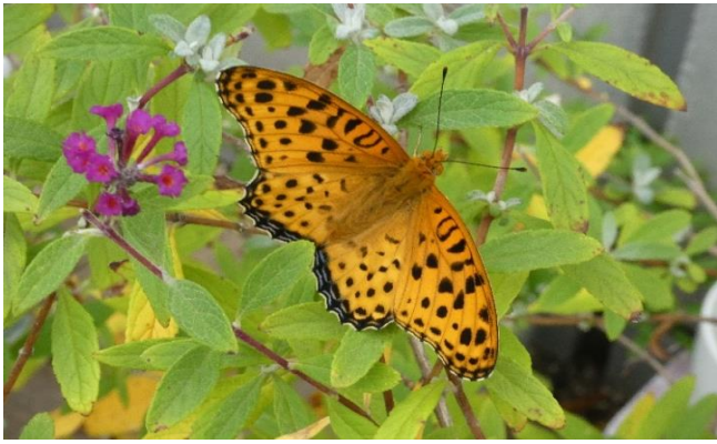
ツマグロヒョウモン(オス)