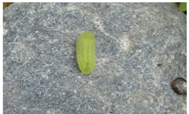
ヤマトシジミの幼虫