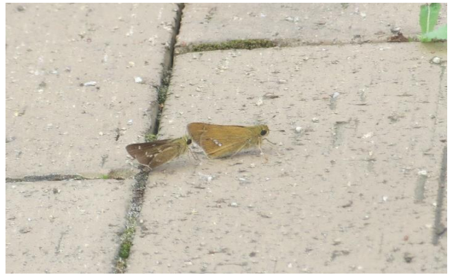
イチモンジセセリ求愛行動