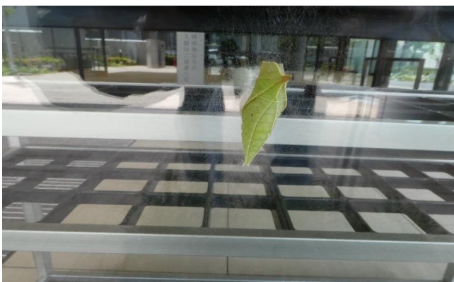
アオスジアゲハ蛹化(玄関ガラスで蛹に)