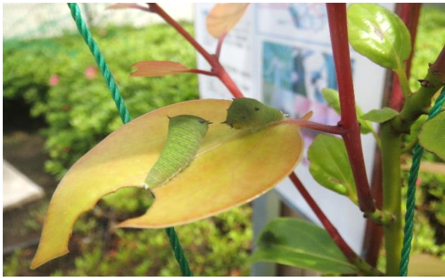
アオスジアゲハの幼虫