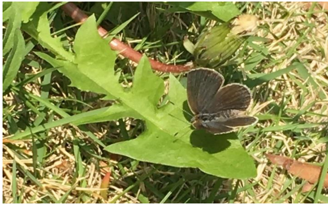
ヤマトシジミ(メス)