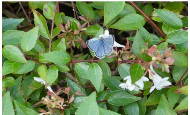
ヤマトシジミ(オス)