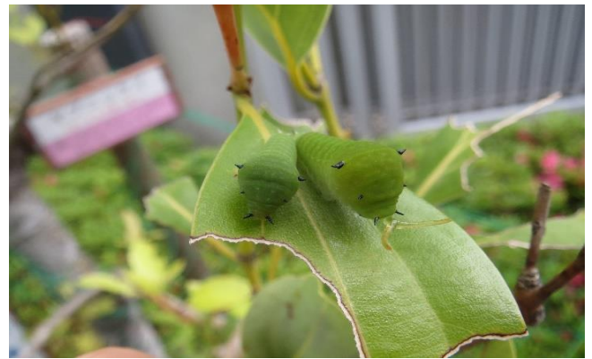
アオスジアゲハの幼虫(威嚇 右側)