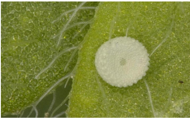
ヤマトシジミの卵(顕微鏡にて)