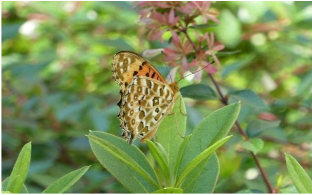
ツマグロヒョウモン