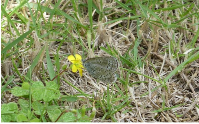
ヤマトシジミ(吸蜜)