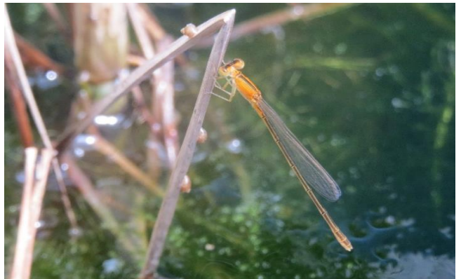
アジアイトトンボ未熟