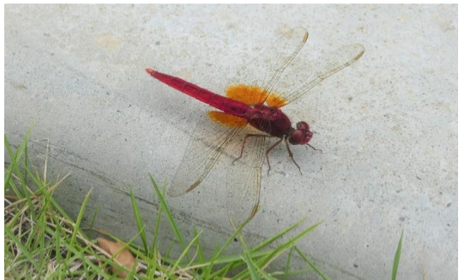
ショウジョウトンボ