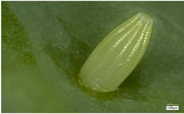
モンシロチョウの卵(顕微鏡にて)