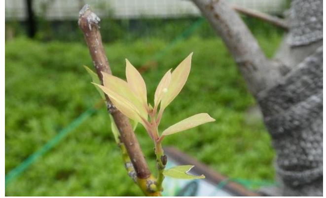
アオスジアゲハの卵(ヤブニッケイに産卵)