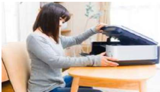
【インクジェットプリンタ部】