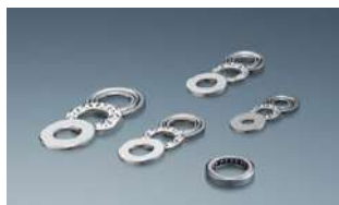
【半導体製造装置 特殊バルブ用】